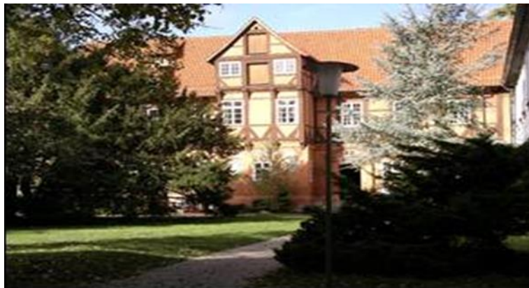
Unterbringung und Verpflegung in der Europäischen Akademie Bad Bevensen